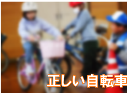
正しい自転車乗り方