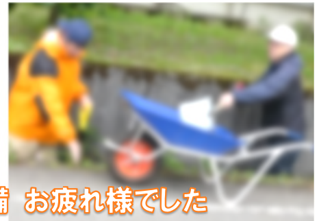
土曜日の早朝から親子で環境整備 お疲れ様でした