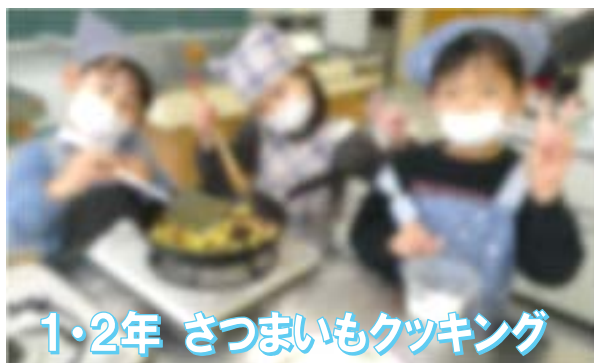
1・2年 さつまいもクッキング