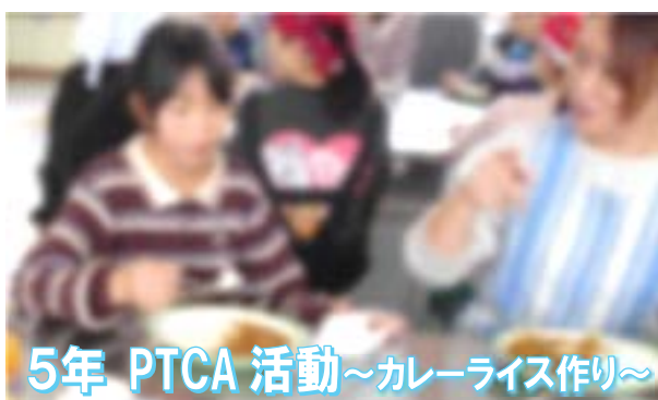
5年 PTCA 活動～カレーライス作り～