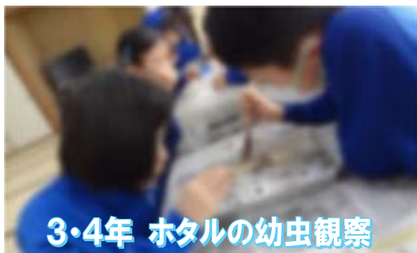
3・4年 ホタルの幼虫観察