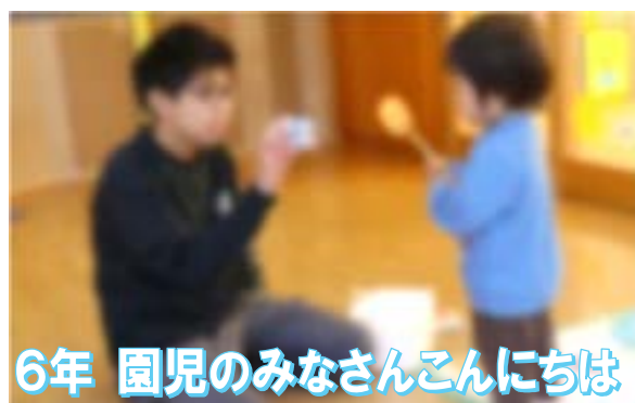
6年 園児のみなさんこんにちは