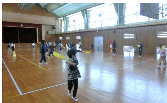
1月13日 スポレックを楽しむ子どもたち

体育館では、子どもたちが毎日ドッジボールをして遊んでいます。しかし、ドッジボールが苦手な子どもには参加しづらい遊びです。