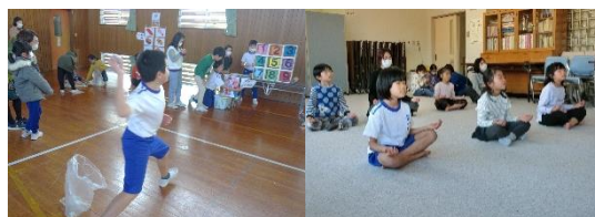
11月、12月のストラックアウトやヨガ

雪が降り、子どもたちが思いっきり遊ぶことができる場所が、体育館のみとなりました。11月から、より多くの子どもたちが運動に親しめるよう、また、健康づくりのきっかけになるような企画を実施しました。保健委員会主催のストラックアウト、先生方によるスポレックやヨガ教室などを行い、多くの子どもたちにスポーツを楽しんでもらいました。