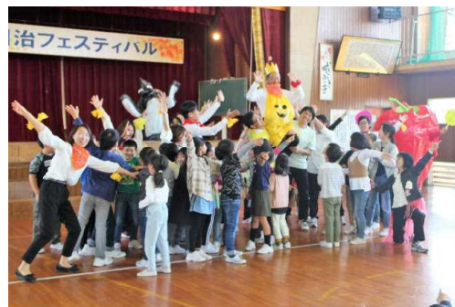
保護者の皆様と盛り上げた文化祭