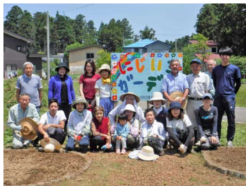
地域の皆様と整備したにじいろガーデン

これからも「地域を愛し、地域に愛される子ども」の育成を目指し、地域とともに歩む学校づくりに努めます。この1年間にいただいた地域の皆様・保護者の皆様のあたたかいご支援に、厚く御礼申し上げます。